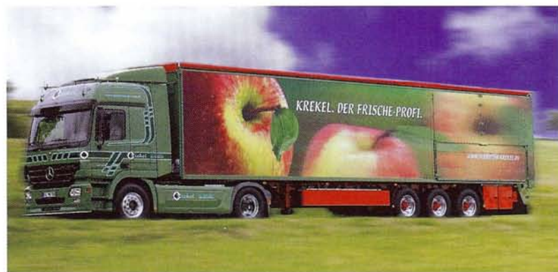
▲ Die Spedition Krekel hat sich auf die zwei völlig voneinander getrennten Geschäftsbereiche „Lebensmittel“ und „Metalle“ spezialisiert. Die eigene Flotte umfasst 20 Fahrzeuge

Zusammenfassung mit Tipps zum wirtschaftlichen und verschleißfreien Fahren und eine visitenkartengroße Tabelle mit Geschwindigkeiten, Verbrauchs- und Zeitwerten. „Diese Karten legen sich die Chauffeure ins Cockpit“, erklärt Hampel. Die kleine Tabelle soll sie ständig daran erinnern, dass ein Tempo von 89 km/h nur einen geringen Zeitvorteil bringt, der obendrein mit einem hohen Mehrverbrauch erkauft werden muss. Als